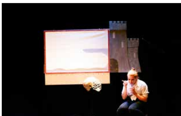
Théâtre d'ombres et le castelet