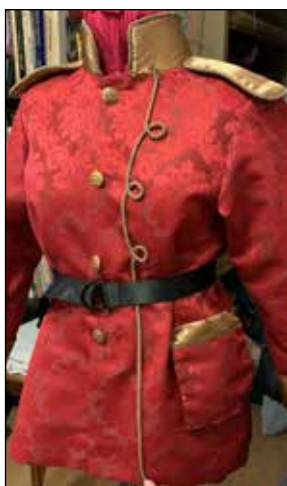
Veste de Boucle d'Or