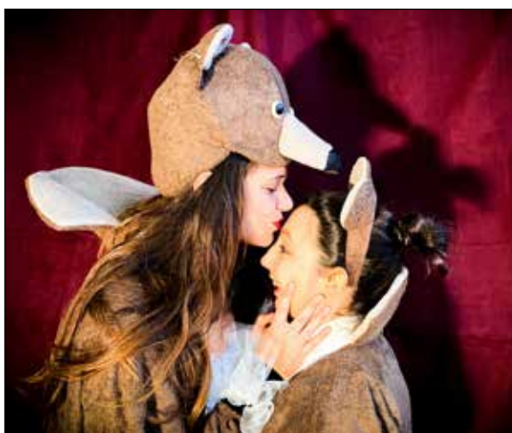
Costume de Maman et Petit Ours