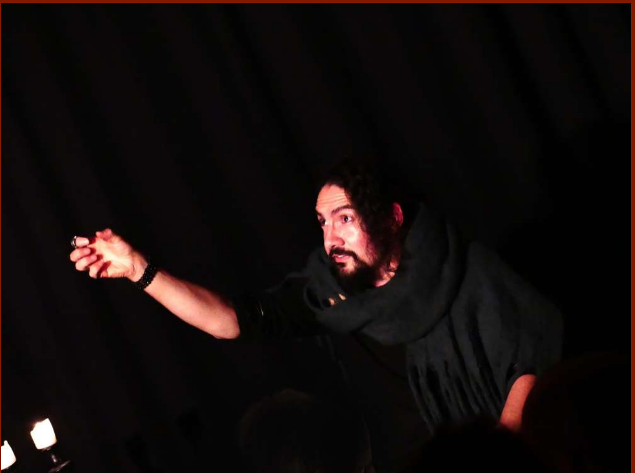
Crédit : Sandrine Pinon ( La P'tite Scène des Halles , Saint-Nazaire, 2024)