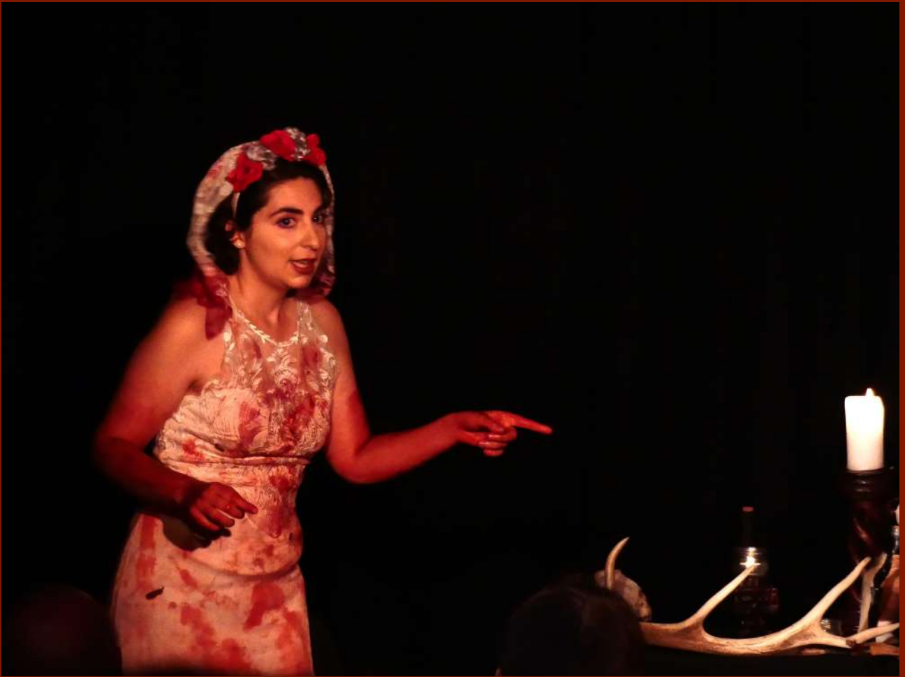
Crédit : Sandrine Pinon ( La P'tite Scène des Halles , Saint-Nazaire, 2024)